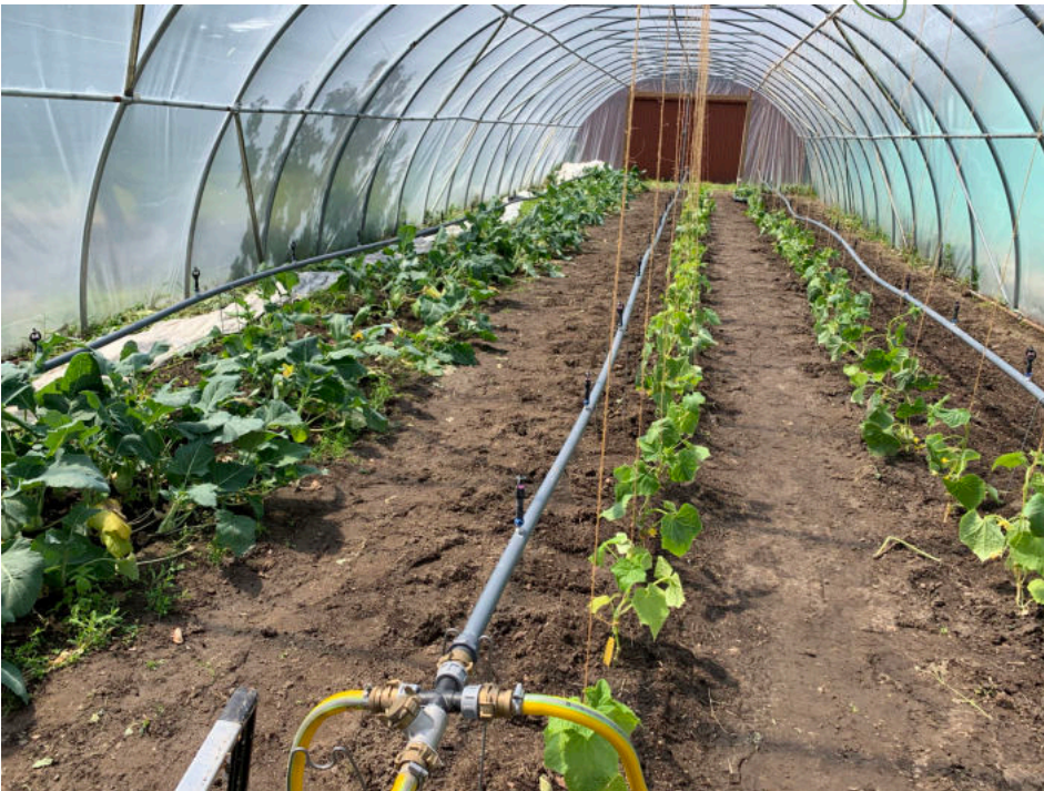
Bild vom 19.05. mit Tröpfchenbewässerung

Den Pflanzen setzen besonders die kalten Nächte und die Trockenheit zu, denn kaltes Wasser aus der Leitung ist etwas ganz anderes als Regen!